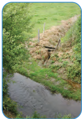
Traitement d'un fossé avec des herbicides à proximité d'un ruisseau du Pays Saint Lois, mai 2005.

Nous avons été désagréablement surpris par les résultats. Le glyphosate («round up»), le diuron et l'AMPA sont présents dans l'ensemble des ruisseaux du bassin, avec des pics impressionnants : 2.25 microgrammes de diuron par litre d'eau du ruisseau des Nonains, et jusqu'à 21.2 microgrammes de glyphosate par litre d'eau du ruisseau du Mézeray !