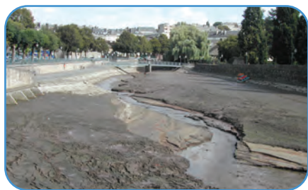
Vidange de l'écluse de Vire – septembre 2006

Collectivités déjà rencontrées : Syndicat d'eau de la Sienne, CC d'Isigny, CC de l'Elle, CC de Carentan, CC de Région de Daye, CC de Canisy, CC de Marigny