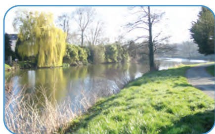
La Vire à Pont Hébert, avril 2006

*Syndicat Mixte du Val de Vire, Syndicat de Développement du Saint-Loïs, Association pour la Promotion du Pays Saint-Loïs.