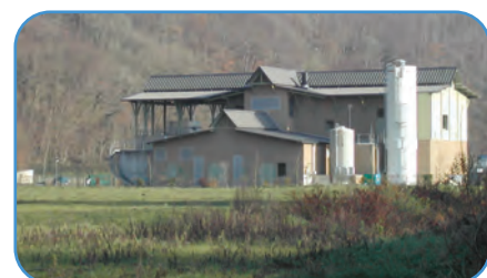
La nouvelle station d'épuration de Saint Lô inaugurée en 2003