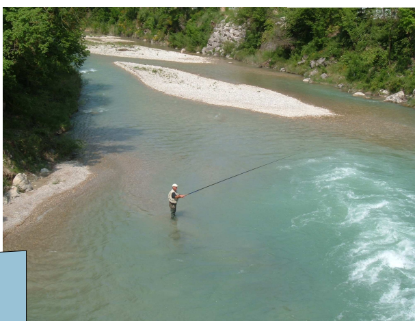
Quiétude en bord de Drôme...

Et puis il faut apprendre à partager cette rivière de façon à ce que tout le monde puisse l'apprécier à sa façon. Une baignade rafraîchissante, une descente sportive, un moment de détente au bout d'une canne à pêche ou tout simplement le vol d'une libellule ... autant de scènes qui participent à la beauté de la Drôme et de ses affluents !