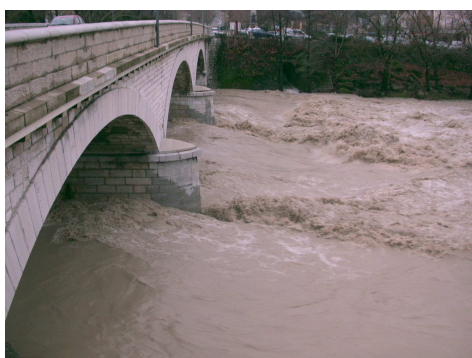
Quand les éléments se déchaînent et qu'il faut se protéger de la colère de notre rivière.

En juin 2004, la candidature du SMRD pour la réalisation d'une étude pouvant déboucher sur un programme d'action et de prévention contre les inondations est retenue par le ministère de l'écologie et du développement durable, permettant de bénéficier de