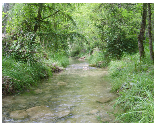
Une rivière bien entretenue.

« stabiliser les berges et assurer le bon écoulement des eaux... augmenter la biodiversité et mettre en valeur le paysage »