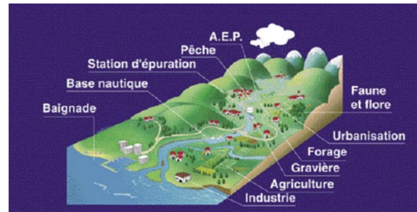
Un bassin versant

Pour le Verdon, le bassin versant concerne 69 communes, sur 4 départements (Alpes-de-Haute-Provence, Var, Alpes-Maritimes, Bouches-du-Rhône).