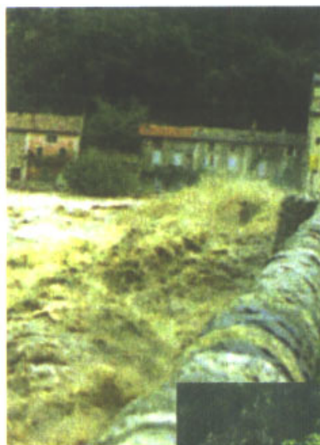
Crue et étiage à Pont de Labeaume

• En cas de danger, des bulletins d'alerte sont diffusés et affichés par les mairies et les préfectures : informez-vous !!