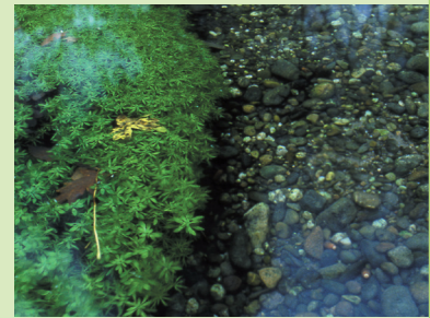
Ces rivières ont une eau particulièrement limpide et leur débit est d'une grande régularité.

Ils sont alimentés au moins en partie par l'eau peu oxygénée de la nappe. Ils rejoignent ensuite le réseau hydrographique ou s'infiltrent à nouveau dans la nappe. Les débits restent souvent peu élevés avec des capacités de dilution limitées. La qualité de l'eau est directement tributaire de la qualité de la nappe et des rejets effectués dans le cours d'eau. Trait d'union entre les eaux souterraines et superficielles, les cours d'eau phréatiques participent au fonctionnement des zones humides qui abritent une faune et une flore d'une grande richesse. Dans la plaine d'Alsace, ils sont un élément fondamental du fonctionnement de cet hydrosystème très spécifique.