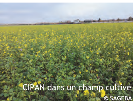
CIPAN dans un champ cultivé

➡ L' érosion d'un sol est un phénomène qui aboutit à un départ de particules du sol. C'est un phénomène dû à des éléments naturels (la pluie ou le vent) mais qui peut être aggravé par l'activité humaine : défrichage, surpâturage, suppression des haies et talus, passage d'engins trop lourds, sols laissés à nu en hiver sont autant de facteurs augmentant les risques d'érosion des sols.