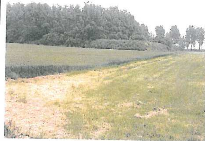
Accès au centre de la zone humide :