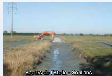
Écours de l'Étoile - Soullans