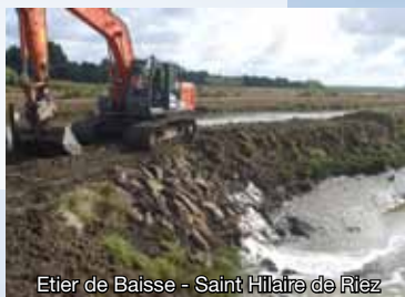
Etier de Baisse - Saint Hilaire de Riez