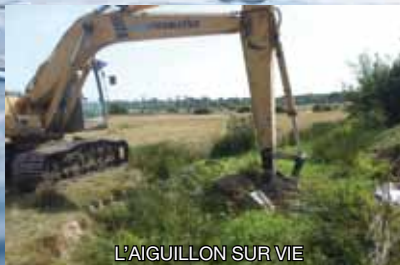
L'AIGUILLON SUR VIE

8 km – 29 890 m 3 de plantes extraits – 25 286 € HT