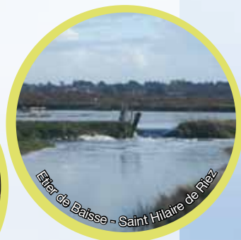
Etier de Baisse - Saint Hilaire de Riez