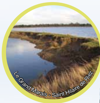
Le Grand Marais - Saint Hilaire de Riez