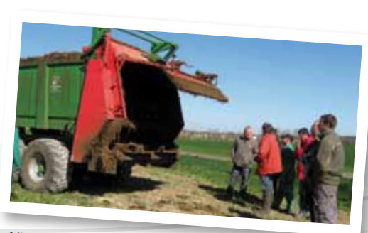
Mieux connaître, valoriser et répartir les engrais de ferme : un enjeu des contrats EVE.

* SAMO : Surface Agricole recevant des Matières Organiques