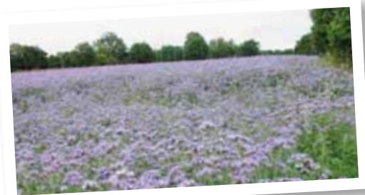
Réduire l'utilisation des pesticides passe par l'utilisation de techniques alternatives : détruire mécaniquement les Cultures Intermédiaire Pièges à Nitrates (ici la phacélie), biner le maïs...