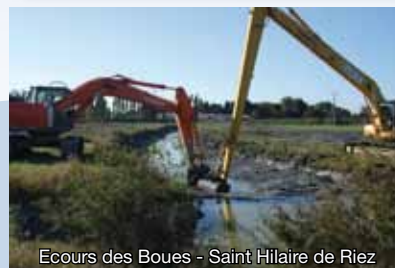
Écours des Boues - Saint Hilaire de Riez