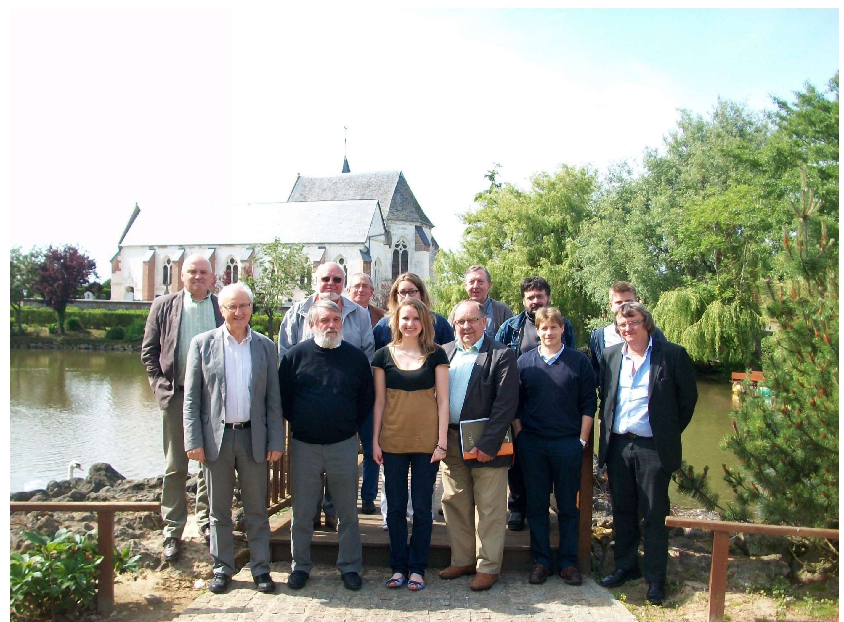
Réunion du Bureau de la CLE le 27 juin dernier