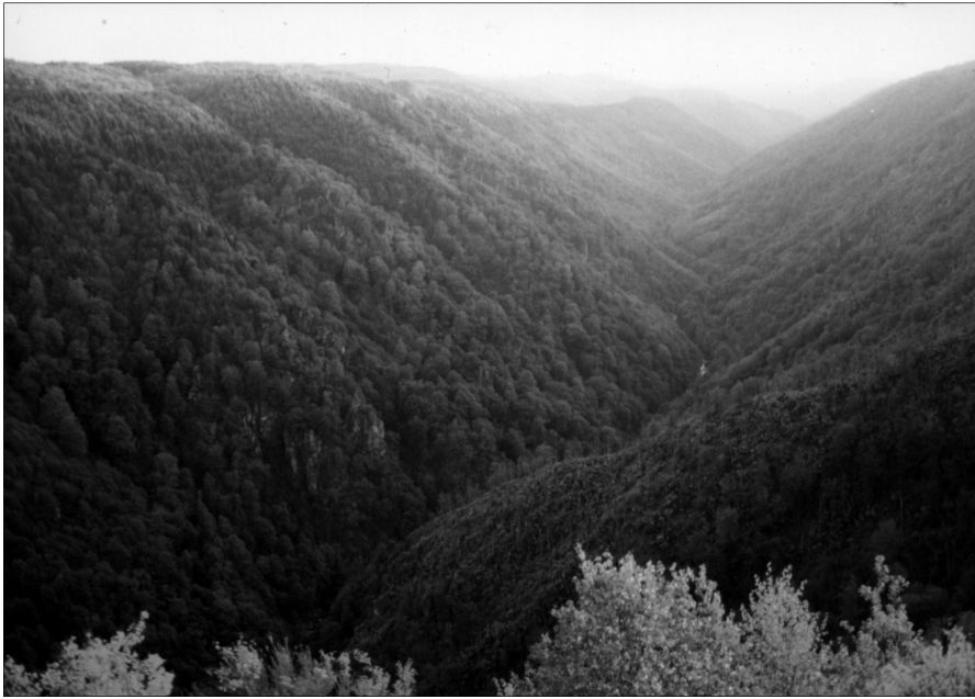
Les gorges de la Cère vue du Rocher du peintre à Camps (19)

Cet espace exceptionnel peut-il attirer visiteurs et amateurs de vraie nature ?