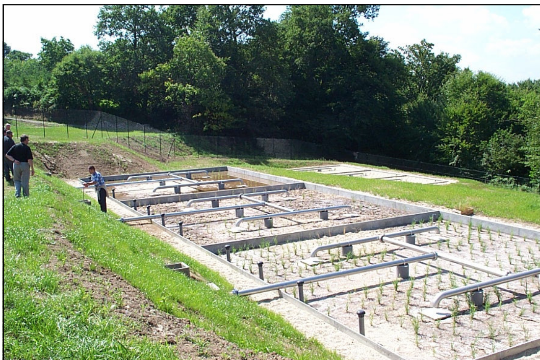
Vue d'ensemble de l'ouvrage

Composé de deux massifs filtrants successifs, le nouvel ouvrage s'intègre parfaitement en bas du bourg, même si les roseaux ne sont pas encore très grands. D'un entretien réduit, cet aménagement pérenne permet de respecter les objectifs de qualité des eaux de la Cère et de ses affluents, pour un investissement de l'ordre de 90 000 €.