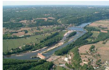
Barrage de Mauzac