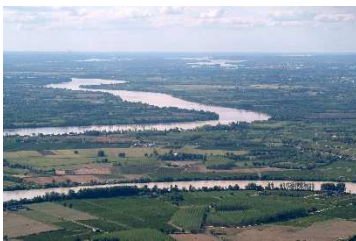
Vallée de la Dordogne en aval de Libourne

Le périmètre proposé se justifie au regard des enjeux présents sur le territoire. Le bassin Dordogne atlantique est découpé en 66 masses d'eau superficielles. Selon l'état des lieux de la Directive Cadre sur l'Eau de 2013, seuls 18 % de ces masses d'eau sont en bon état . Les principales pressions concernent les pollutions diffuses, notamment nitrates et phytosanitaires, les modifications du régime hydrologique (écluées, suppression des crues morphogènes), l'altération de la dynamique fluviale (seuils, étangs, déséquilibre sédimentaire, ...) ou encore les déséquilibres quantitatifs. A ces pressions s'ajoutent également la régression des zones humides, la prolifération d'espèces invasives ou encore la vulnérabilité du territoire aux inondations.