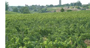
Coteaux viticoles en Gironde