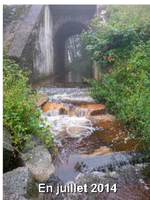
En juillet 2014