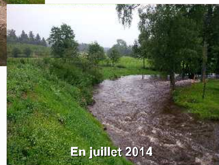
En juillet 2014