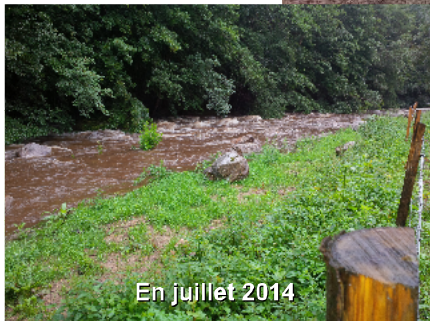
En juillet 2014