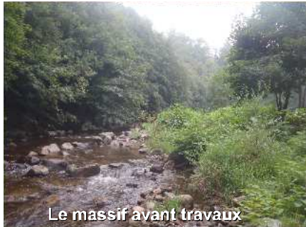
Le massif avant travaux