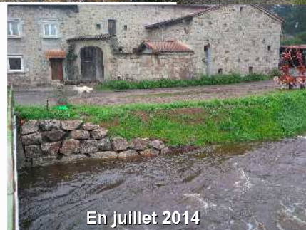
En juillet 2014