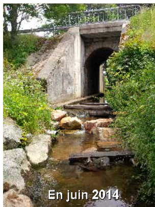
En juin 2014