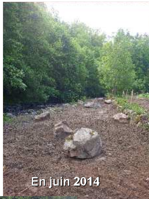
En juin 2014