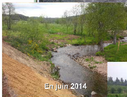
En juin 2014