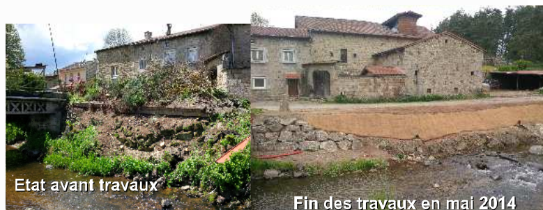
Etat avant travaux