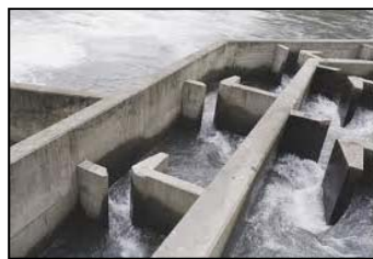
Passes à poissons

Le SBV a lancé une étude d'avant projet permettant de proposer des scénarii d'aménagement des deux moulins, en concertation avec les propriétaires. Les travaux, qui suivront l'étude, devraient permettre de reconnecter la quasi-totalité de la Cent Fonts naturelle à horizon 2013. Par ailleurs, le moulin de la Folie fera l'objet d'une démarche identique permettant de reconnecter la Vouge amont en 2015.