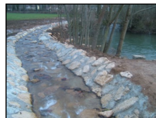
Rivière en contournement

Exemples de travaux de reconnexion écologique