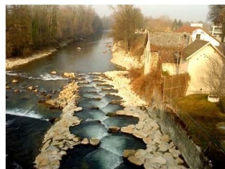
Exemple de bassins en cascade

Les solutions retenues d'un commun accord (arasement de seuil et bassins en cascade) permettront de très nettement améliorer la montaison et la dévalaison des espèces piscicoles tout en réduisant notablement le phénomène d'accumulation des sédiments en amont des ouvrages. Désormais, le bureau d'études doit au cours de la dernière phase de la démarche proposer un avant projet précis afin de dimensionner les nouveaux ouvrages et de connaître le coût de leurs réalisations. A ce stade, les financeurs institutionnels semblent prêt à accompagner financièrement [très largement] le projet... A suivre !