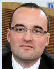
V LE MEAUX