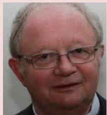
Y LE SEGUILLON