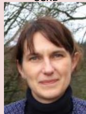
S LE NOUVEL