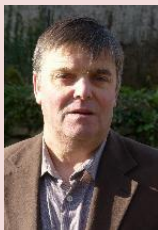
Y LE BIANIC