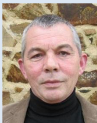
Y J LE COQU