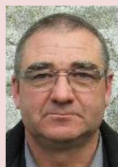
Y LE BARS