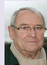
C LE MERDY