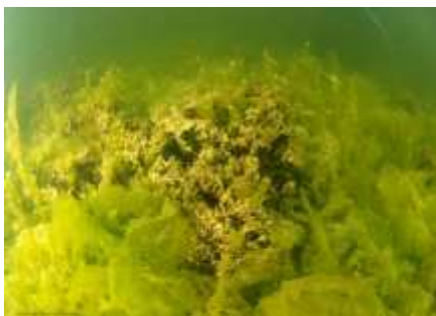
Algues sous-marines

Les différentes masses d'eau du bassin versant (nappe, cours d'eau, étang...) présentent une qualité « moyenne » à « mauvaise ». Il y a aujourd'hui huit captages prioritaires présents sur l'ensemble du bassin demandant une attention particulière. Cependant, la mise aux normes des stations d'épuration a amorcé une amélioration de la qualité de l'eau. Mais le diagnostic a confirmé que l'état d'eutrophisation de l'étang de l'Or était important. Les efforts restent donc à poursuivre notamment au niveau des rejets urbains et agricoles.