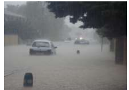
Inondations Baillargues 20 oct. 2008

Les caractéristiques méditerranéennes confèrent au bassin versant un fort caractère inondable. Le territoire doit se doter des moyens nécessaires pour mettre en œuvre les solutions permettant de protéger la population et leurs biens tout en favorisant le bon fonctionnement des milieux aquatiques.