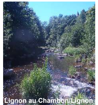
Lignon au Chambon/Lignon