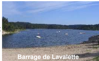
Barrage de Lavalette

La Commission Locale de l'Eau a été créée en septembre 2004, la durée du mandat des membres de la CLE étant de 6 ans, elle a donc été renouvelée en décembre 2010 (outre les modifications lorsqu'un membre perd les fonctions pour lesquelles il a été élu).