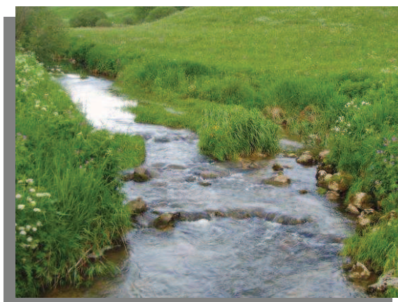
La Morte

Le SAGE fait le choix d'une ambition forte pour le respect des équilibres naturels. Il affirme une volonté de protéger l'ensemble du système, et non uniquement les éléments remarquables, sur lesquels se concentrent aujourd'hui les dispositifs de gestion. Il fixe, au-delà de l'objectif de bon état des eaux et du respect du principe de non-dégradation, des objectifs de qualité pour la reconquête d'un patrimoine qui s'est dégradé ces dernières années même si il reste de bonne qualité à l'échelle nationale.