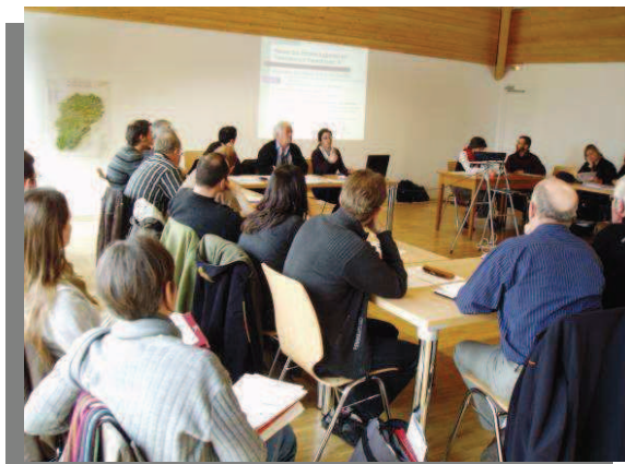
Réunion de la CLE

L'enjeu transversal n°1 « connaissance, suivi et communication » recouvre les besoins de connaissance identifiés, la nécessité d'un suivi précis de la mise en œuvre du SAGE, et les actions de communication vers les publics du territoire. La sensibilisation des populations et des professionnels est identifiée comme un point important pour l'amélioration de l'état des ressources en eau du territoire.