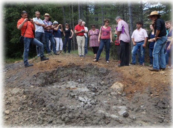
Visite du site de St Félix de Pallières par le groupe de travail et rencontres des élus et riverains, le 19 juin 2014

La CLE des Gardons accorde une attention particulière à ce dossier en raison des impacts potentiellement forts sur les compartiments eau et sédiments et a sollicité l'Etat via le courrier adressée le 22/12/2014 sur la prise en compte des remarques et questionnements soulevés et souhaite bénéficier, en tant qu'acteur et animateur de la gestion de la ressource en eau sur le bassin versant des Gardons, d'informations régulières sur l'avancement de ce dossier. Les compléments demandés apparaissent indispensables pour mieux appréhender l'impact de la pollution minière du site sur les milieux aquatiques. Cet impact potentiel peut être considéré comme un risque important de non atteinte d'un bon état écologique des masses d'eau situées à l'aval du site.