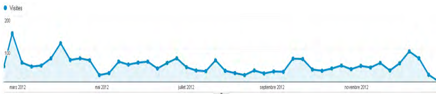
Evolution du nombre de visites par semaine de fin février à fin décembre 2012