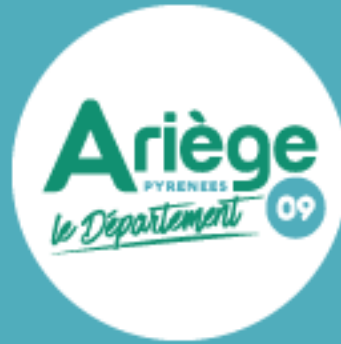
Schéma d'Aménagement et de Gestion des Eaux (S.A.G.E.) des Bassins Versants des Pyrénées ariégeoises (B.V.P.A.)