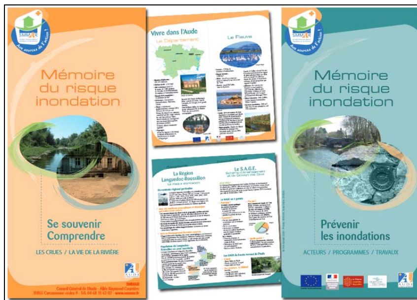
Dépliants "Mémoire du risque inondation" - 2009

Concernant le volet littoral du SAGE à proprement parler, l'accent a été mis sur la gestion durable de l'eau et l'intégrité du bassin concerné : mémoire du risque pour les citoyens, appuis logistiques aux communes, accompagnement pour les différents acteurs, etc. Un deuxième PAPI est en cours de finalisation : un axe concerne le volet spécifique des risques liés aux remontées marines et aux ouvrages de protection existants sur le littoral.